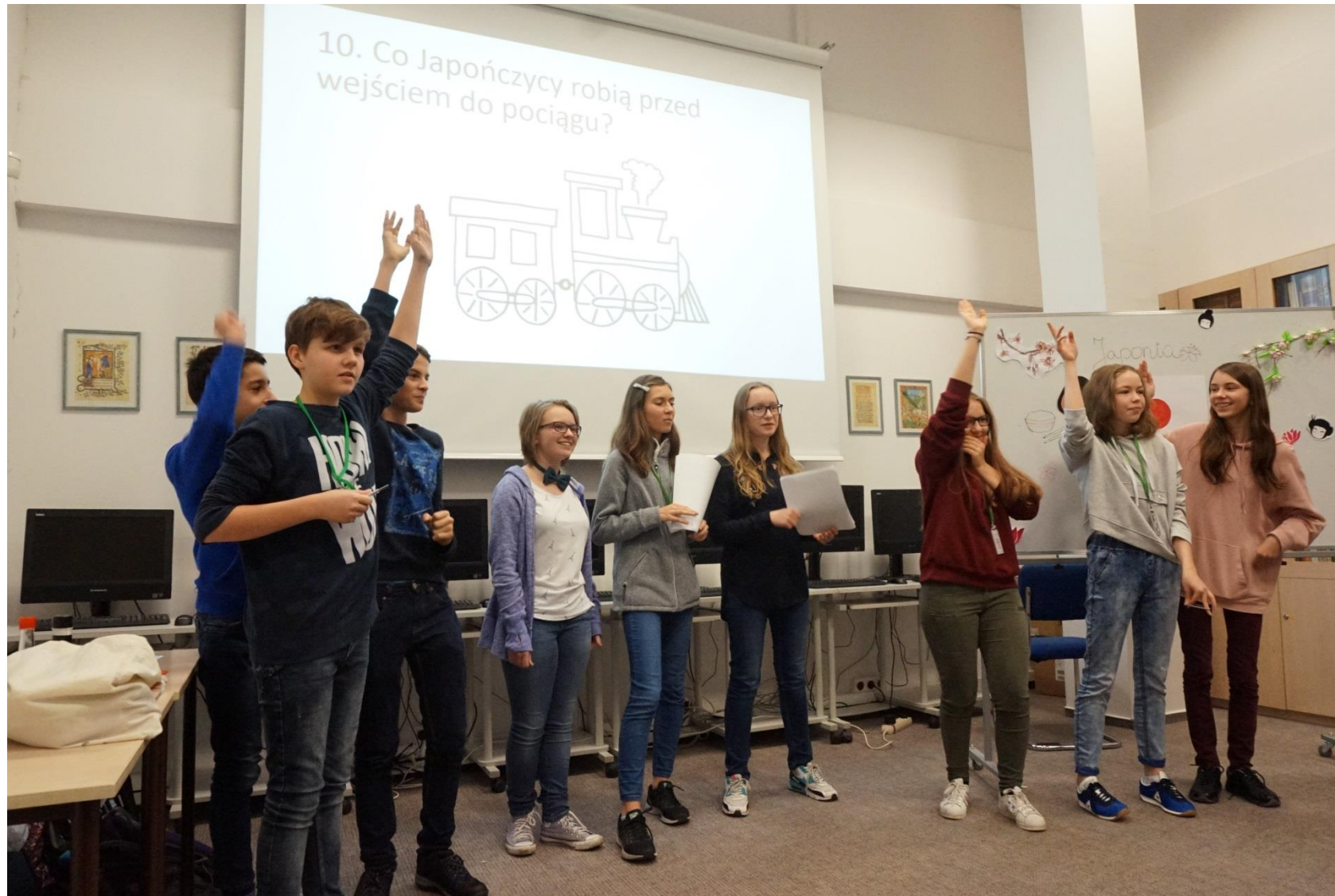
Quiz o tematyce japońskiej (Szkoła Podstawowa 369 im. A.B. Dobrowolskiego)