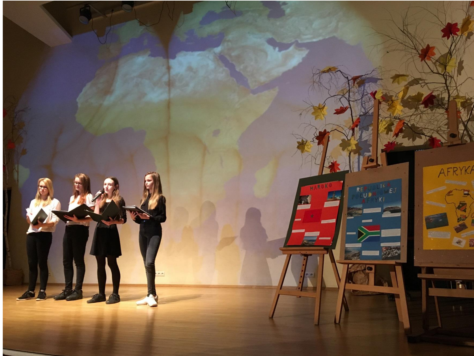
Multimedialna prezentacja o wybranych krajach Afryki (Zespół Szkół nr 74).