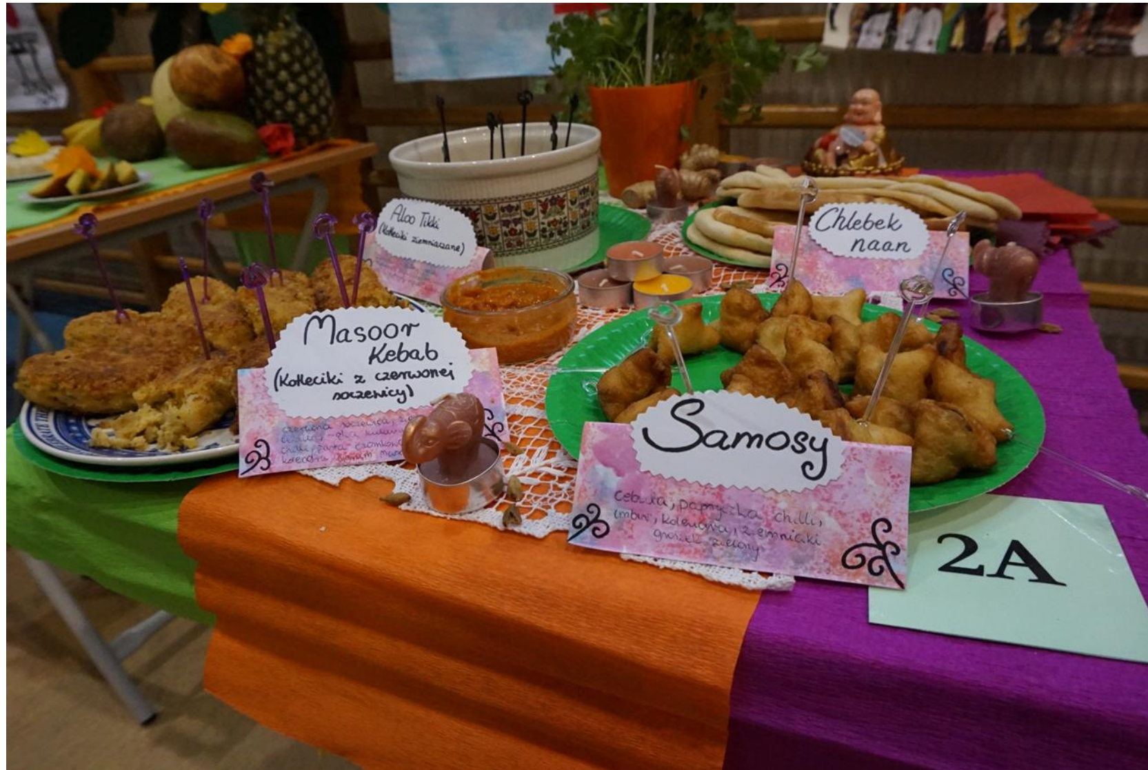
Stoiska z tradycyjnymi potrawami wybranych krajów Azji i Pacyfiku (Szkoła Podstawowa nr 367 im. Polskich Noblistów).