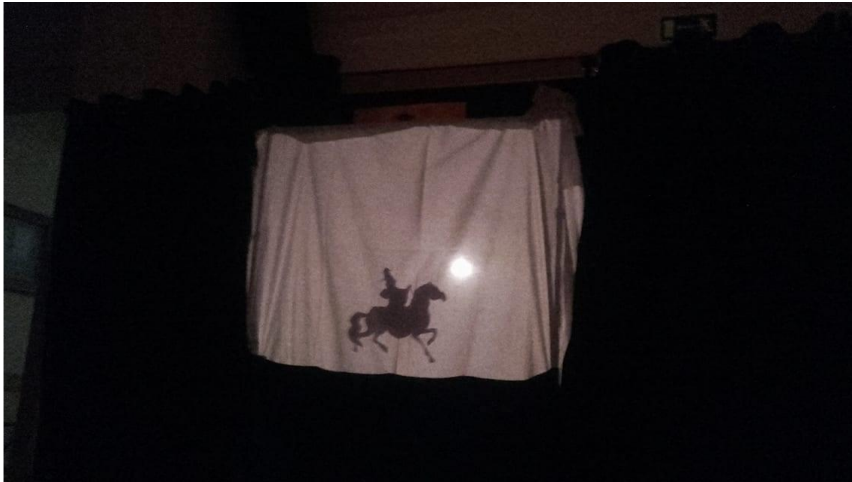
Przedstawienie teatru cieni (LCVIII Licem Ogólnokształcącym z Oddziałami Dwujęzycznymi im. Księżnej Izabeli Czartoryskiej)