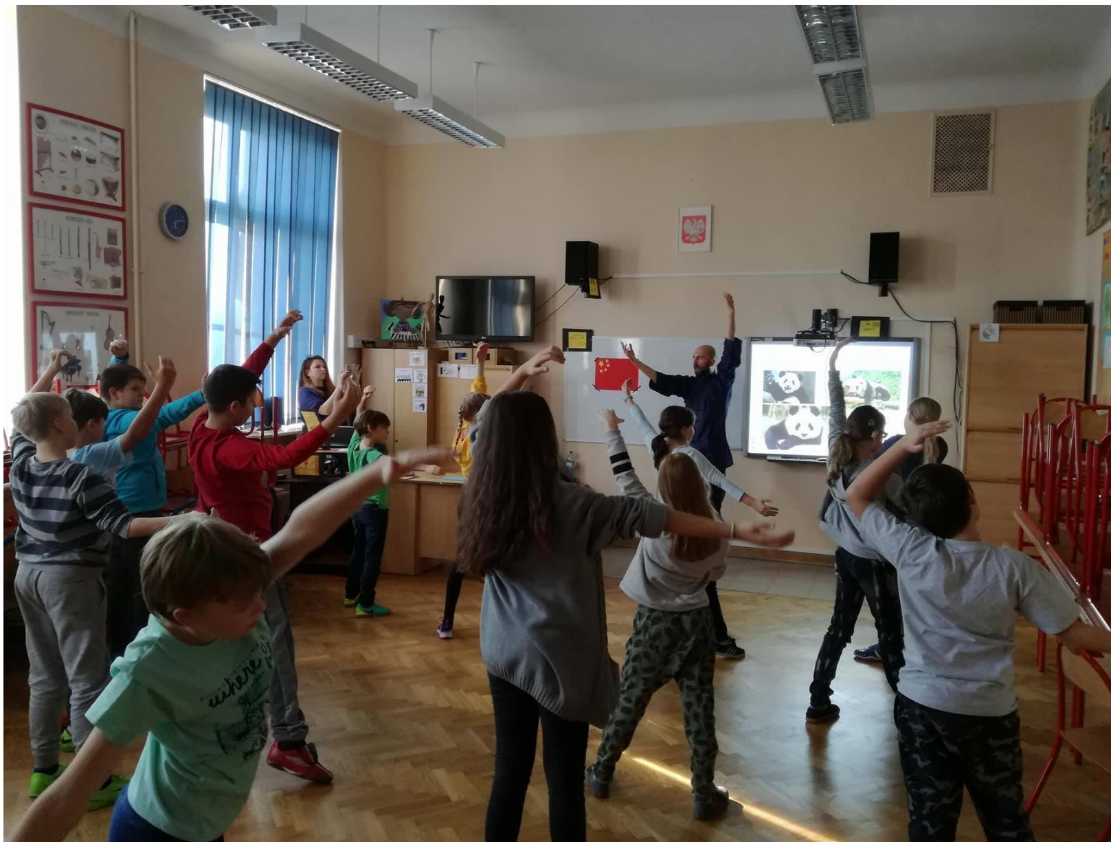
Warsztaty tai-chi (Szkoła Podstawowa nr 41)