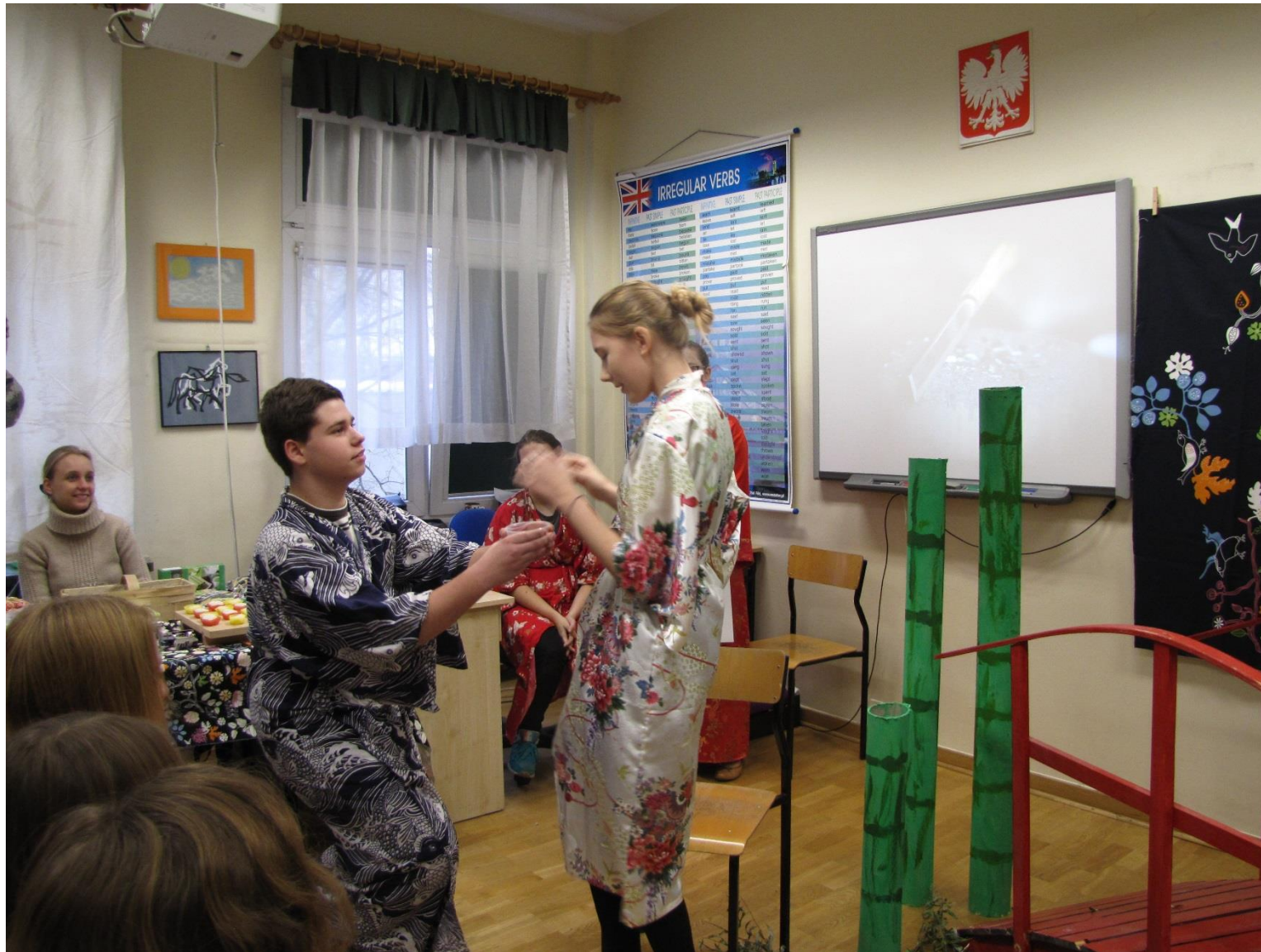
Inscenizacja japońskiej baśni (CLIX LO im. Króla Jana III Sobieskiego).