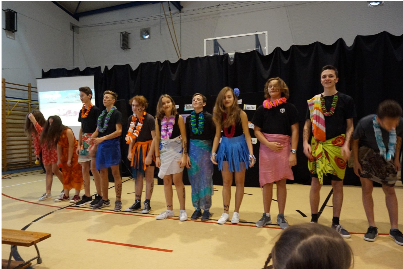
Pokaz tańca Hawajskiego (Szkoła Podstawowa nr 367 im. Polskich Noblistów)