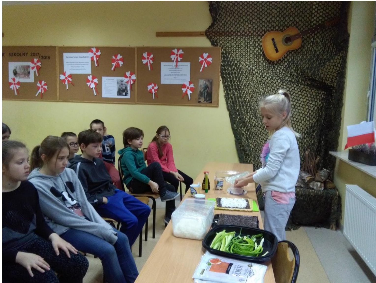
Warsztaty sushi (Zespół Szkół z Oddziałami Integracyjnymi nr 41)