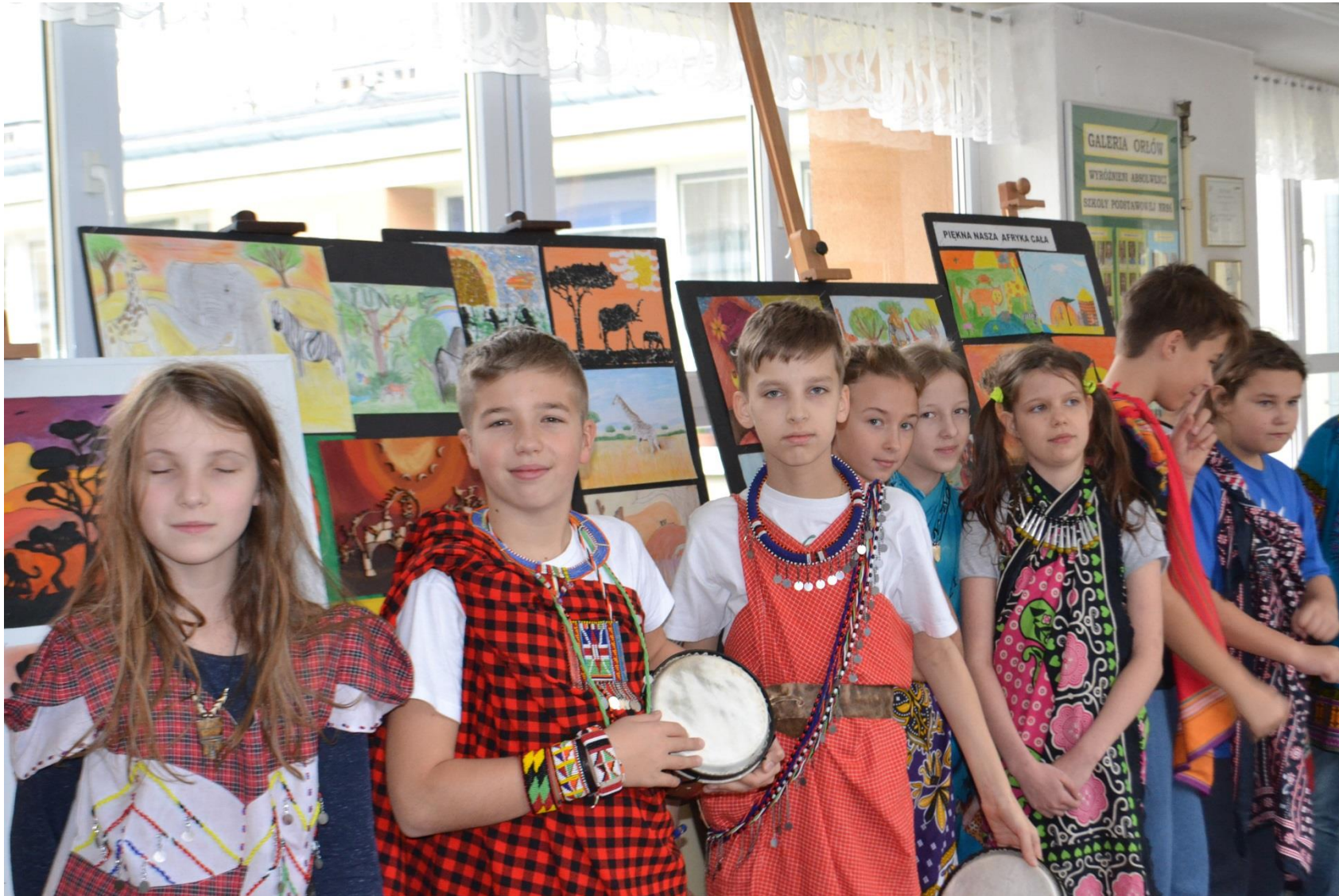
Wystawa prac plastycznych i pokaz strojów afrykańskich (Szkoła Podstawowa nr 86 im. Bronisława Czecha)