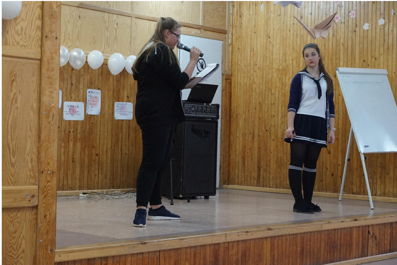
Prezentacja japońskiego stroju szkolnego (Szkoła Podstawowa nr 375)