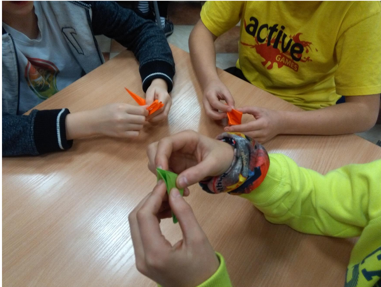
Warsztaty origami (Zespół Szkół z Oddziałami Integracyjnymi nr 41)